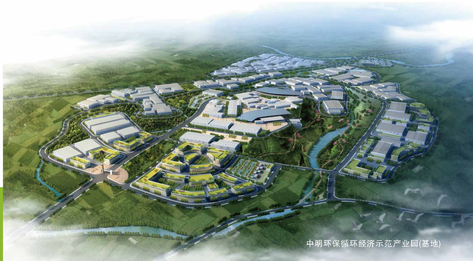
中明环保循环经济示范产业园(基地)