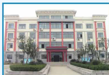
2012年3月 四川中明办公楼