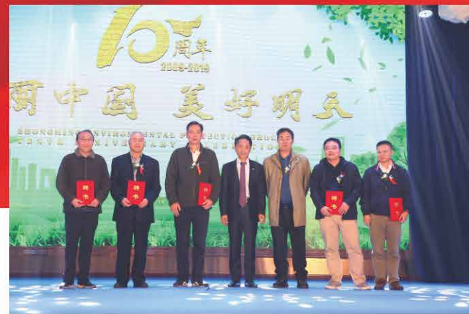
给专家顾问颁发聘书