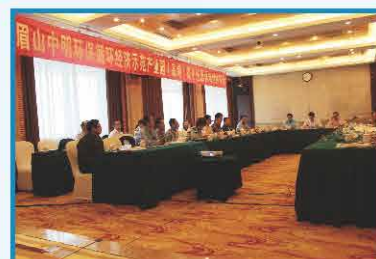
2018年4月 中明环保循环经济示范产业园 (基地) 概念性总体规划通过评审