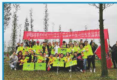
2019年3月 中明环保积极参加 2019眉山东马