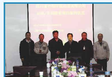
2016年1月 四川中明回转窑项目 签约仪式合影