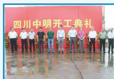
2015年6月 四川中明公司隆重开工合影