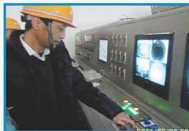
2011年3月 焚烧车间点火启动仪式