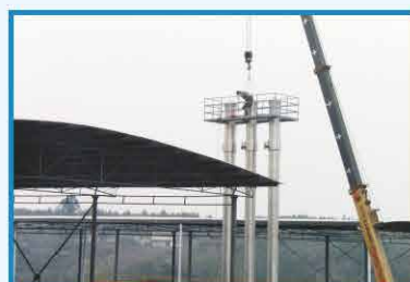
2012年3月 四川中明设备安装现场