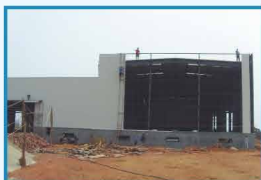
2010年6月 四川中明配伍间建设