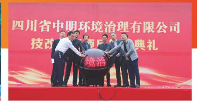
技改扩能项目投产

四川中明不仅为当地环境质量改善发挥了积极作用，还为当地经济发展做出了积极贡献。据了解，四川中明成立10年以来，已累计向当地政府缴纳各类税款3.2亿元，有效地带动当地经济的发展。就业是民生之本，四川中明积极发挥优势，吸纳当地劳动力就业，目前，吸纳当地就业人员近786人，引进硕士以上人才30余名，有效带动了当