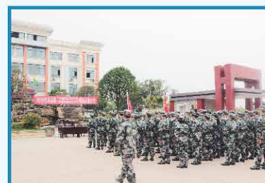
2018年4月 正式成立交通运输暨防化救援 民兵分队