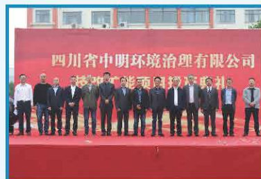
2019年5月 技改扩能投产典礼