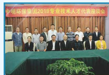
2018年9月 中明环保专业技术人才代表 座谈会