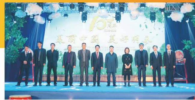
四川中明10周年庆典

四川中明始终坚持把工艺的革新作为突破口，向科技要空间、要动力、要活力。10年来，公司处置范围覆盖国家危险废物名录49大类中的39类，年处置与综合利用能力达30万吨以上，已经发展成为集工业废物收集处置及综合利用、医废收集与处