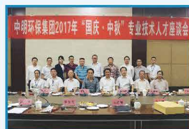
2017年9月 中明环保集团第一届 人才座谈会