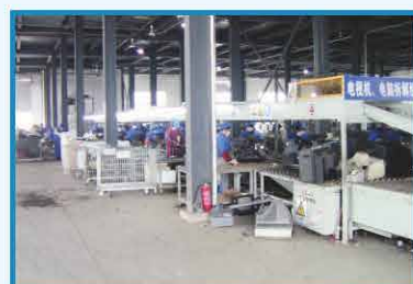
2012年3月 四川中明电子拆卸车间