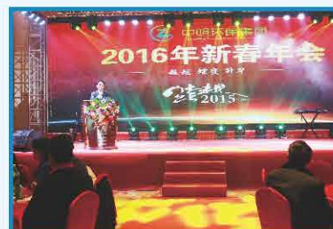
2016年1月 新春年会董事长致辞