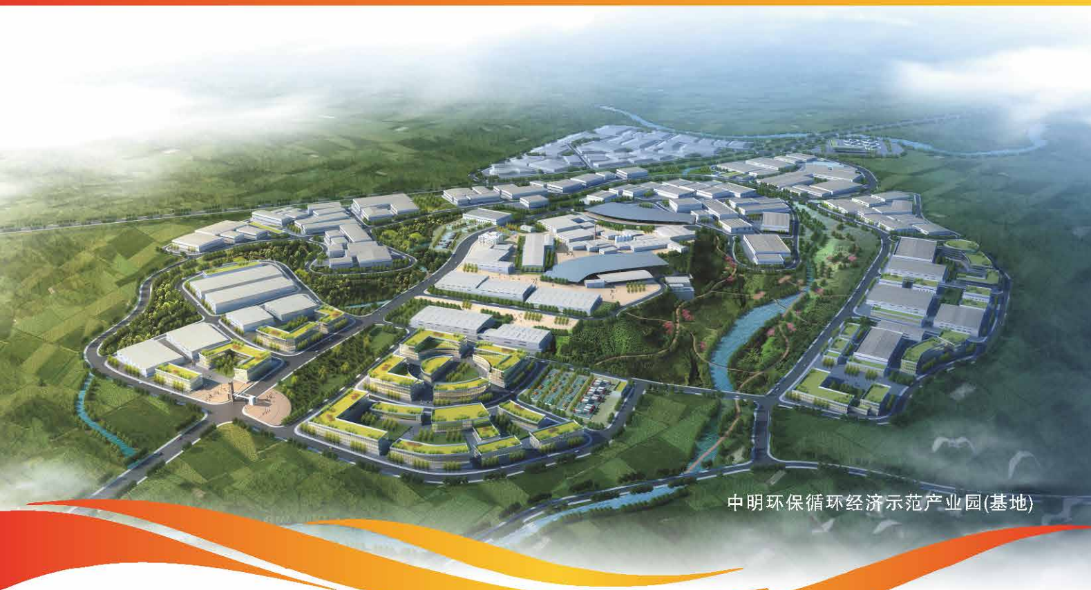
中明环保循环经济示范产业园(基地)