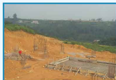
2010年7月 四川中明水处理车间建设