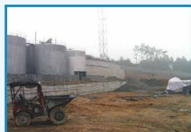
2012年3月 四川中明水处理建设初期