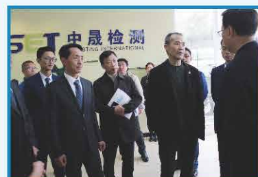
2010年 万科集团王石来访