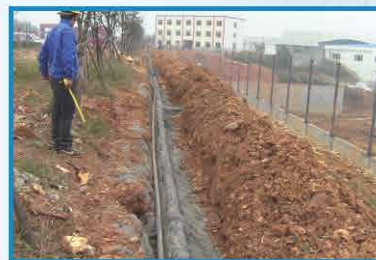
2011年10月 消防管道建设过程中