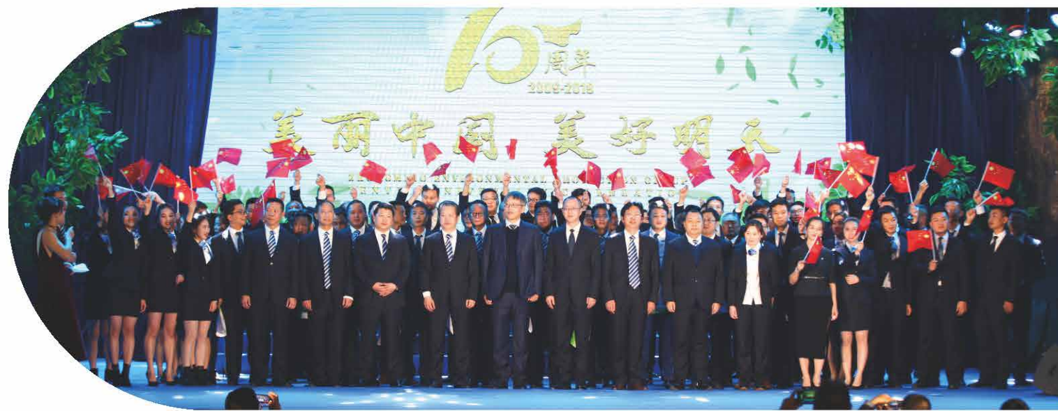
四川中明10周年大合影