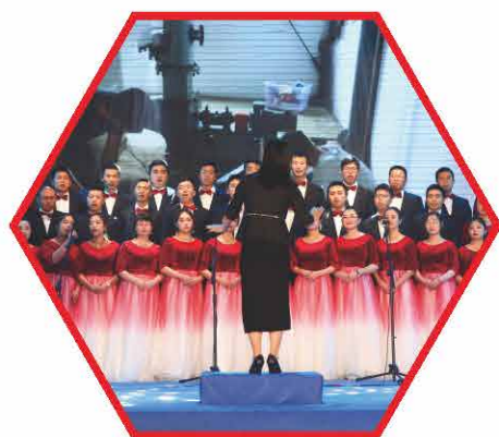
精彩纷呈的合唱比赛