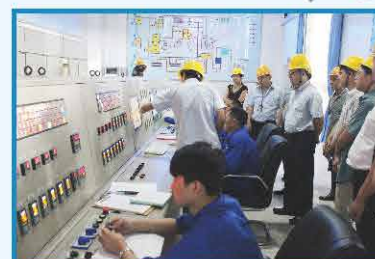
2013年5月 通过西南环境保护督查中心检查