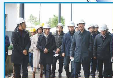
2019年11月 省政协副主席钟勉莅临考察