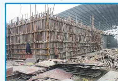
2013年1月 四川中明水处理建设现场