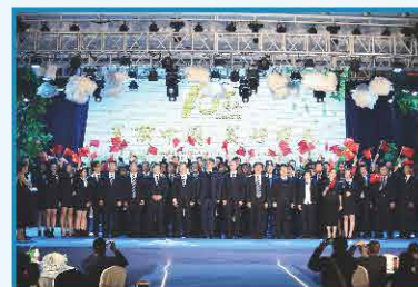
2019年11月 10周年庆典活动合影